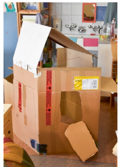
Nach dem Baustellenbesuch wird die Karton-Spielwelt zur Grossbaustelle, um eigene Konstruktionen zu erproben.