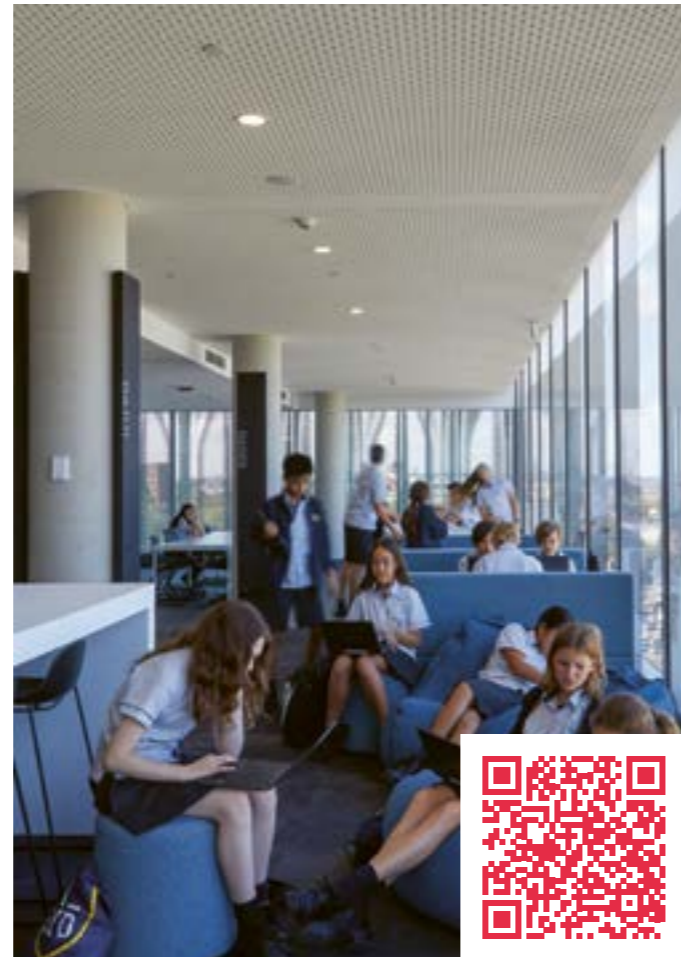
Vertikale Architektur für 1200 Schüler:innen auf einem engen städtischen Gelände. Inner Sydney High School, Sydney von fjcstudio.