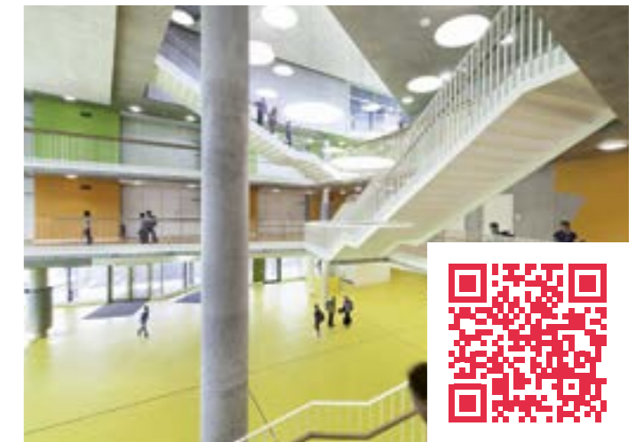
Im Aussenbereich bieten vielfältige Landschaftsformen Platz für aktives, körperliches Spiel. Edith Neville Primary School in London von Hayhurst & Co Architects.