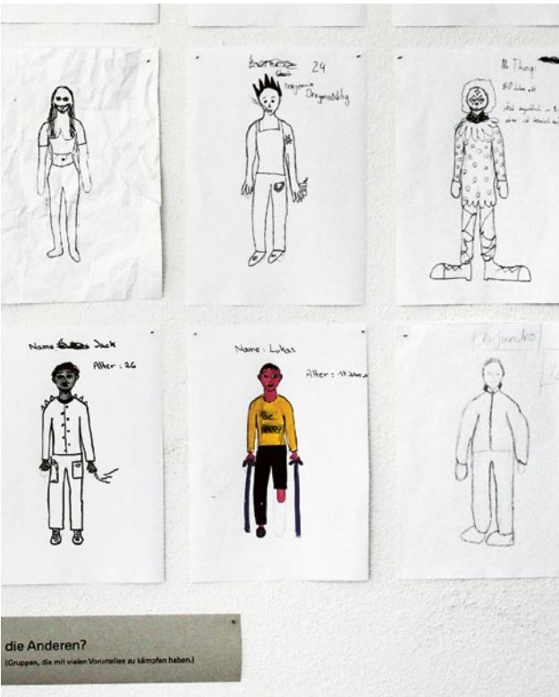
Mit einer spannenden, interaktiven Schulhausausstellung werden SuS motiviert, sich mit Vielfalt auseinanderzusetzen.