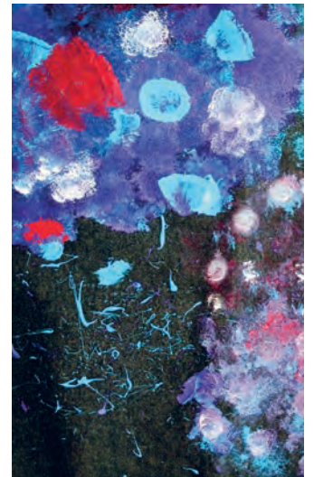
Versuch, Weltallstimung mit Textilfarben zu interpretieren