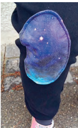
Galaxy-Wirkung durch Kombination von glänzend, glattem Polyacryl-Elastan-Mix mit matter Baumwolle sowie Kniepad mit Transferdruck des Moodbilds