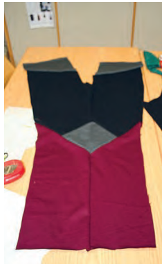
Begutachtung der Beinproduktion als Zwischenschritt