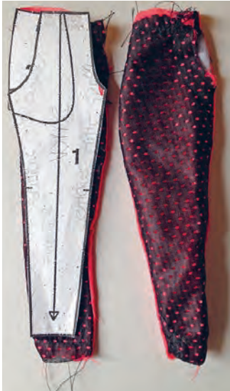
Mini-Hose zum Experimentieren mit Schnittmuster und Arbeitsschritten