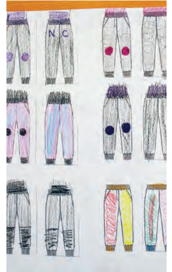
Zeichnung verschiedener Farbkombinationen für die Schnittteile