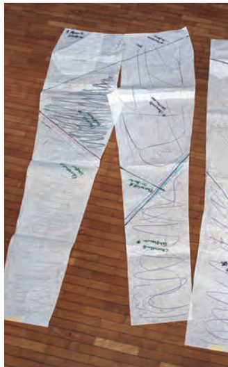
Kontrolle der Schnittlinien anhand des Schnittmusters