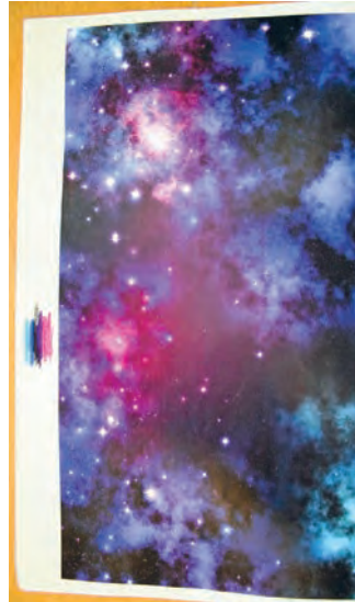
Bild als Inspirationsquelle für die Farbgebung