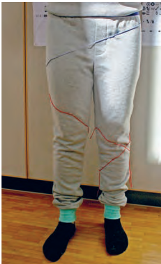
Prototyp, auf dem die Schnittlinien mit Garn festgesteckt sind