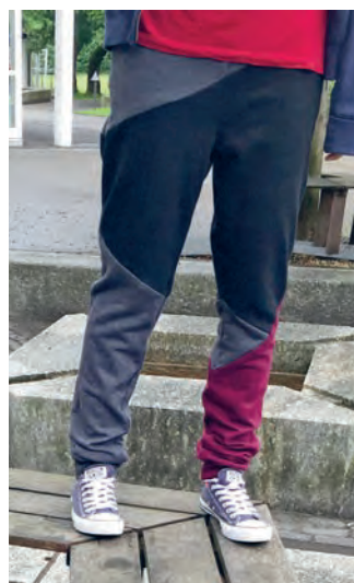
Die geometrische Musterung wird durch durchdachte Farbgebung sowie Schnittlinien, die diagonal über beide Beine geführt sind, geschaffen