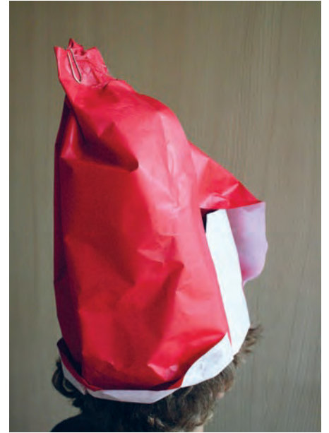
Zuerst wird die Form und mögliche Farben des Hutes skizziert und anschliessend mit Papierexperimenten ausgestaltet.