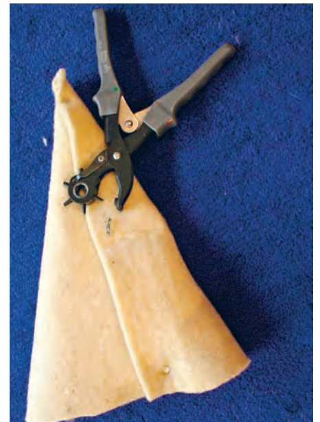
Anhand des Papiermodells werden die Filzteile ausgeschnitten. Sie können mit Heftklammern provisorisch fixiert werden.