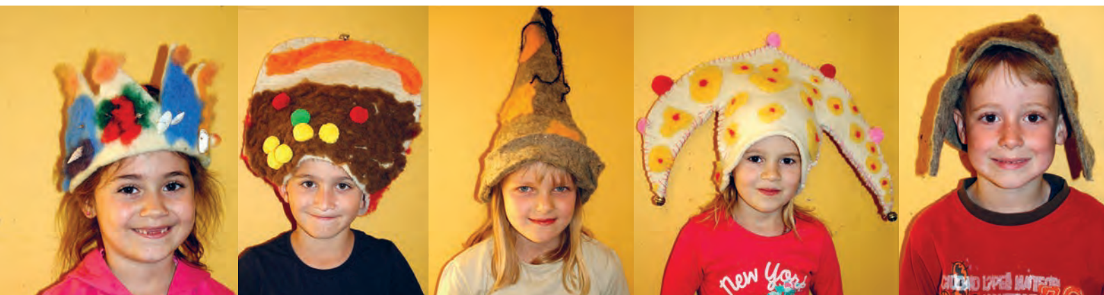
Mit ihren Hüten verwandeln sich die Kinder in Märchenfiguren ... Arielle, Clown, Hexe, Kasperli und Ritter.