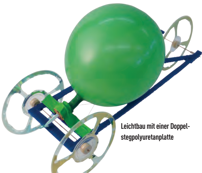
Leichtbau mit einer Doppelstegpolyuretanplatte