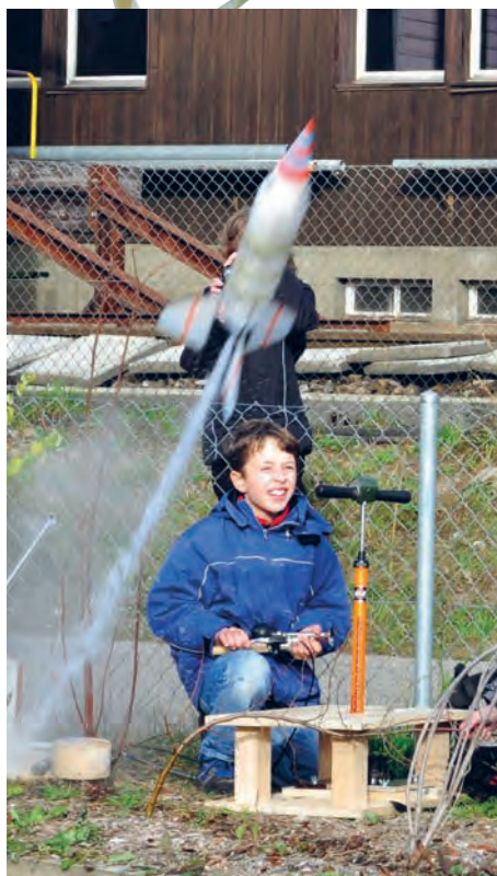
Technisches Experiment PET-Rakete