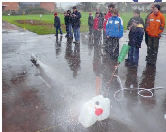
Aufgabenstellungen zu Rückstossantrieben (mit Wasser-Luftgemisch) differenzieren und erweitern das Unterrichtsvorhaben.