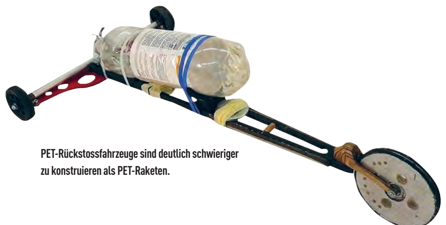
PET-Rückstossfahrzeuge sind deutlich schwieriger zu konstruieren als PET-Raketen.