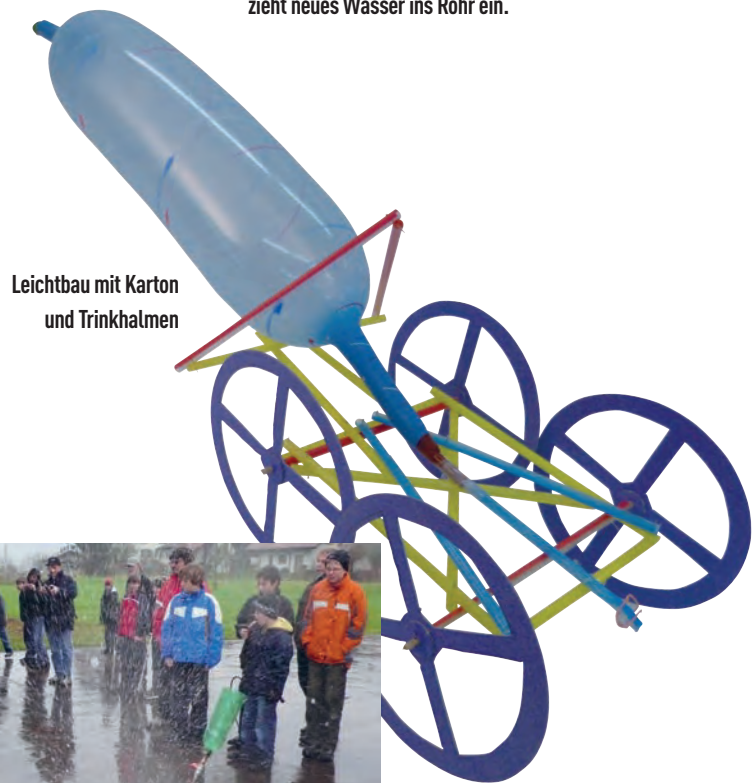
Leichtbau mit Karton und Trinkhalmen