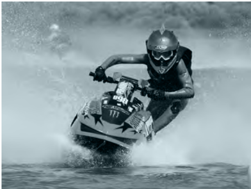
Jetskis funktionieren mit Wasserstrahlantrieb, respektive Rückstossprinzip.