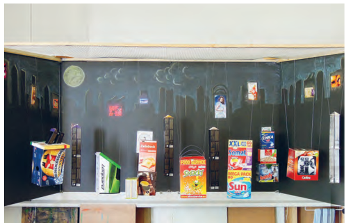
Leere Räume, bisher unbeachtete Ecken und altbekannte Ansichten eines Schulhauses erhalten durch die Ausstellung ein ganz neues Gesicht.