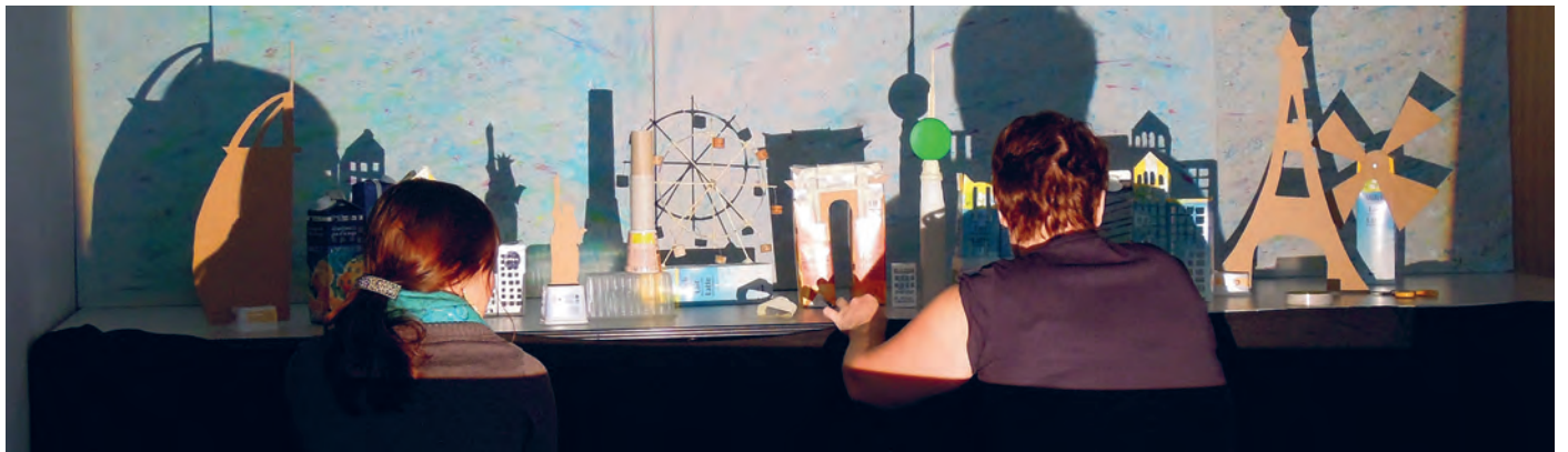
Alle denkbaren Materialien, Techniken und Medien kommen bei der abschliessenden Ausstellung zum Einsatz.