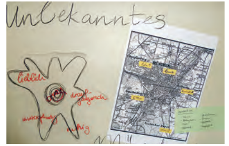
Die Rauminterventionen werden von A – Z selbständig geplant – Grundlage dazu ist eine ausführliche Recherche über bestehende Städte und alternative Möglichkeiten.