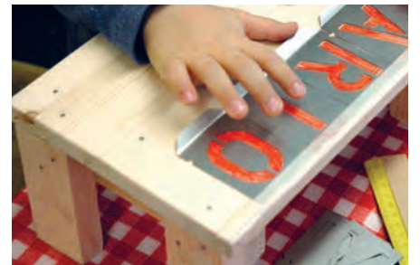
Im Team arbeiten – gemeinsam finden die Kinder Lösungen und unterstützen sich bei der Umsetzung.