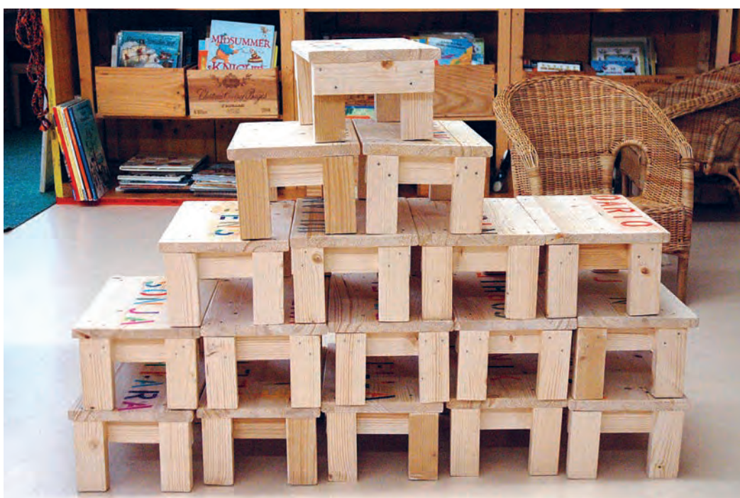
Verändern und entstehen lassen – das Objekt verändert sich laufend. Es entstehen neue Räume.