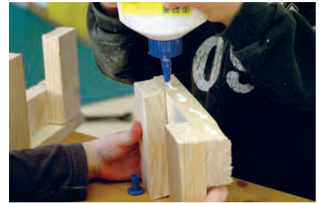
Überlegen und ausprobieren – aus einzelnen Stücken wird im Rahmen der offenen Werkstatt ein Ganzes.