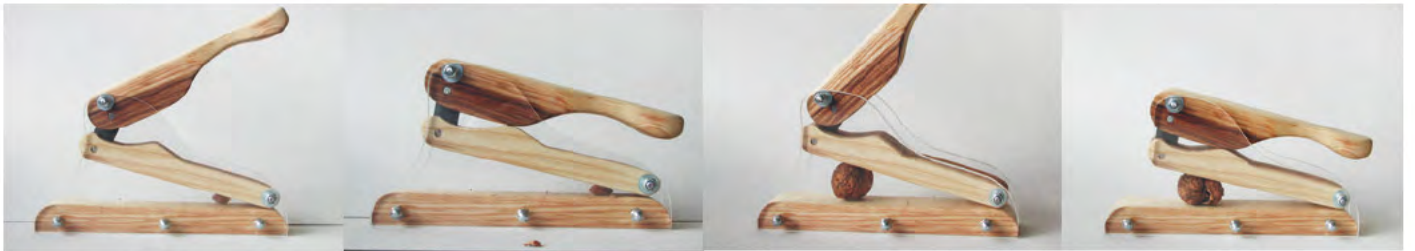
Zur Auswertung werden verschiedene Nüsse geknackt.