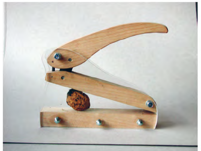
Bei den Ergebnissen stehen auch Gestaltung und Ausführung auf dem Prüfstand.