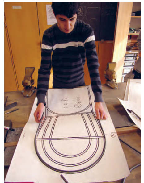
Mit dem Plan 1:1 geht die Arbeit schnell voran.