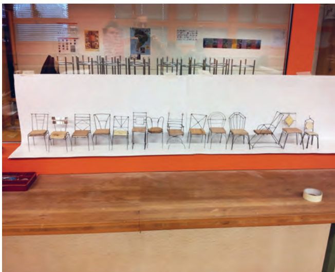
Mit den Miniaturen wird das Endprodukt sichtbar und die Planung 1:1 leichter.