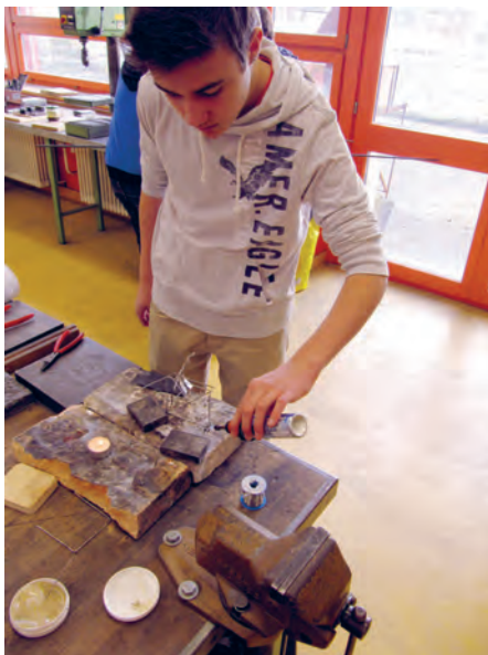
Beim Weichlöten muss die Löttemperatur genau stimmen.