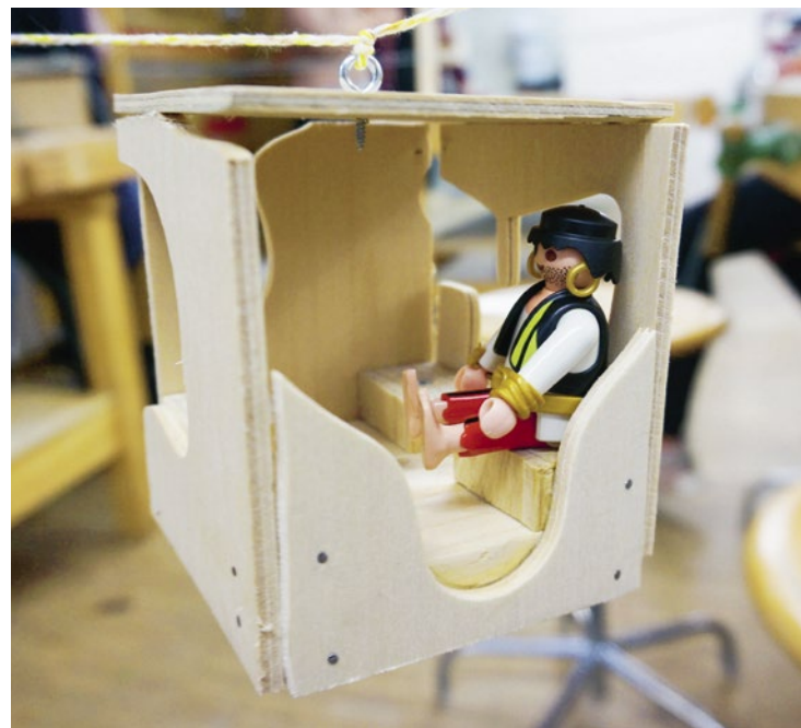
Kreative Lösungen für den Bau der Umlenkrolle, die Montage der Trag- und Zugseile oder die Absicherung der wertvollen Fracht.