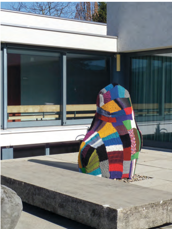
Guerilla (Urban) Knitting trägt eine politische Botschaft in den öffentlichen Raum.