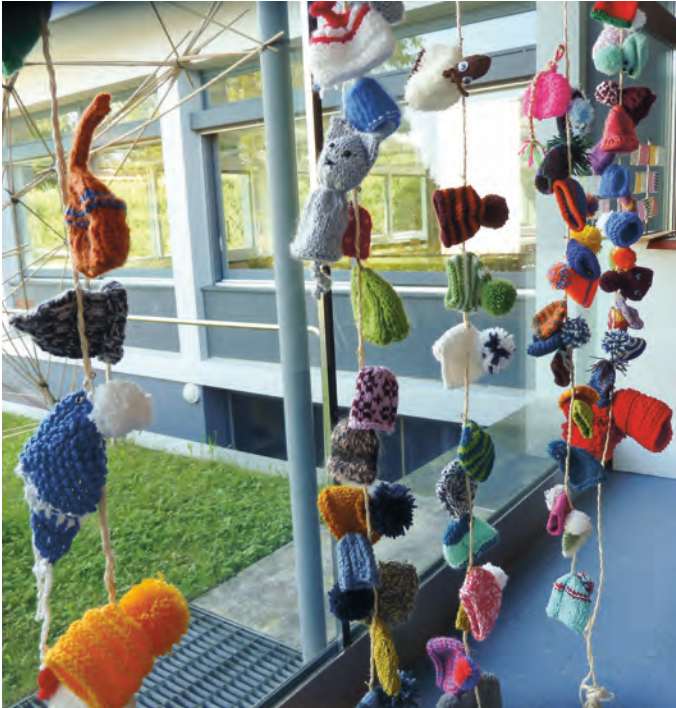
dasgrossestricken.ch sammelt Mini-Mützen für den guten Zweck (für Pro Senectute).