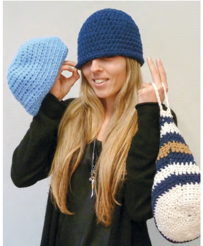
MyBoshi.net bietet Anleitungen für Mützen, Taschen und Deko zum Kauf.