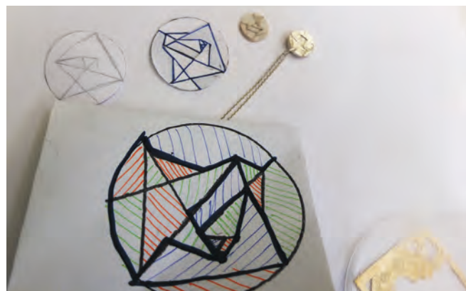
Im gleichen Verfahren gefertigte Anhänger aus Silber.