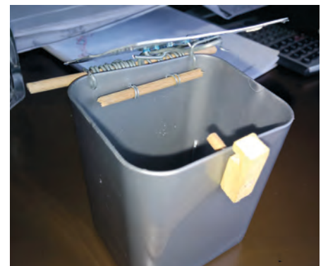
In den Produkten zeigt sich die unterschiedliche Funktion von Abdecken und Bedecken.