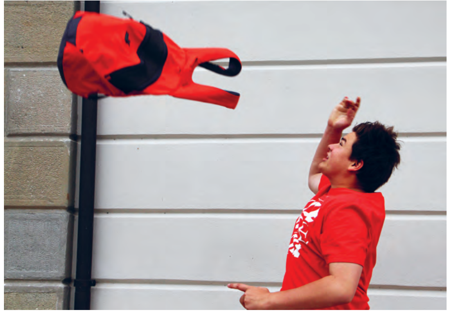
Als Einstieg setzen sich die Teilnehmer mit ihrer (gekauften) Lieblingstasche ins Szene.