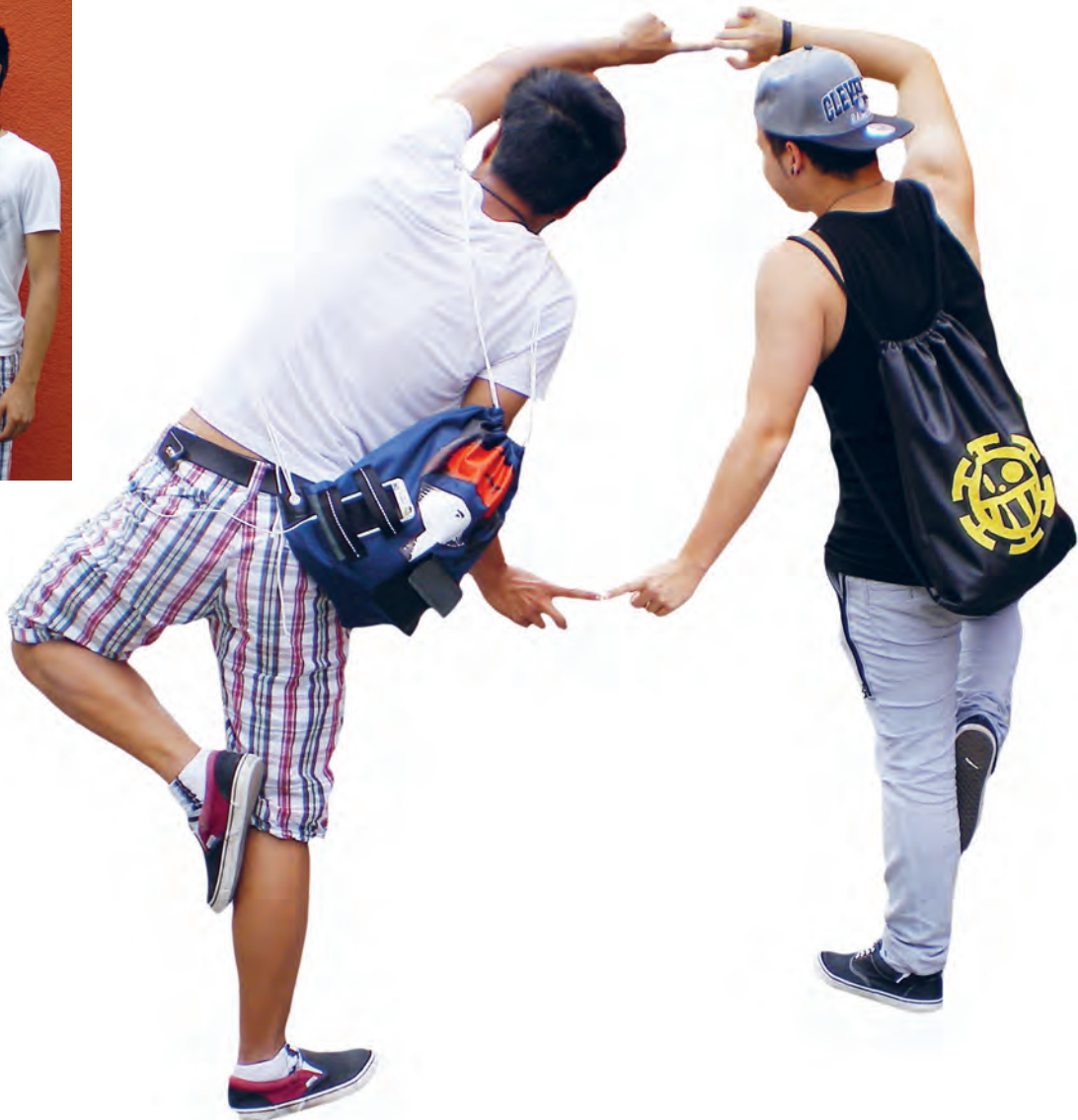
Jeder «backbag» ist ein Unikat – entweder bemalt oder mit Applikationen verziert.