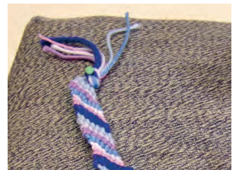
Drehen, Sticken, Flechten, Häkeln und Knoten – die Schülerinnen und Schüler wenden verschiedenste Verfahren an.