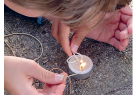
Entdecken, experimentieren und testen – im Rahmen der Materialkunde werden die Naturfasern kennengelernt.