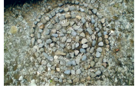
Hinter einem Baum oder doch lieber etwas abseits im Graben – mit natürlichen Materialien markieren die Kinder ihre Lieblingsplätze.