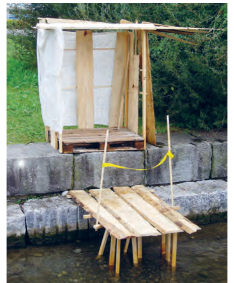
Ausgehend von einer Holzharasse entstehen lauschige Plätzchen und erstaunlich stabile Sitzgelegenheiten – wie das abschliessende Testsitzen beweist.